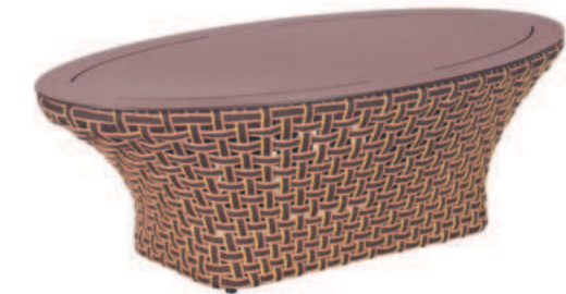
TABLE BASSE OVALE TALI

Référence : T-2001P Ht 77 x P 67 x L 64 cm Hauteur d'assise : 47 cm