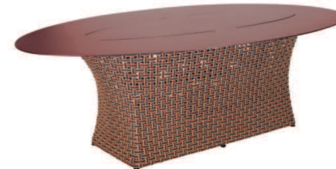
TABLE DE REPAS OVALE TALI

Référence : T-2004-2P Ht 60 x P 70 x L 70 cm