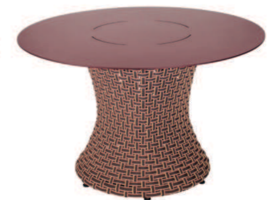
TABLE DE REPAS RONDE TALI

Référence : T-2002P Ht 75 x P 120 x L 240 cm