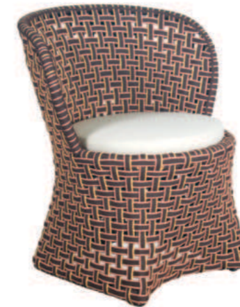
FAUTEUIL DE TABLE TALI

Références : Pouf T-2008P Ht 43 x P 50 x L 50 cm Table basse T-2009P Ht 38 x P 50 x L 50 cm