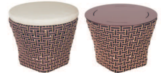
POUF / TABLE BASSE RONDE TALI

Références : Classique T-2006P Tournant T-2006SWP Ht 77 x P 92 x L 97 cm – Hauteur d'assise : 42 cm